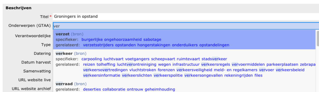
Afbeelding 3: voorbeeld van het autocomplete-overzicht van de GTAA in MAIS-9 bij het invoeren van de eerste drie letters van de beoogde term 'verzet'.

Een belangrijke, specifieke vraag voor prettig gebruik van een thesaurus is, welke gegevens over een concept/term getoond moeten worden tijdens het annoteren. Met andere woorden: wat heb je als documentalist nodig om de relevantie van een concept voor het record dat je beschrijft te bepalen?